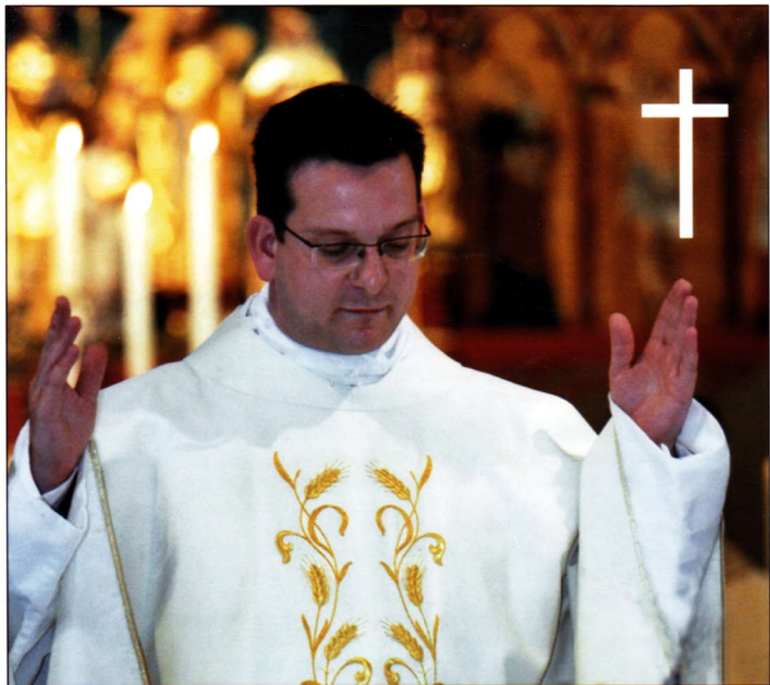
Sacerdos in Aeternum (priester tot in eeuwigheid)