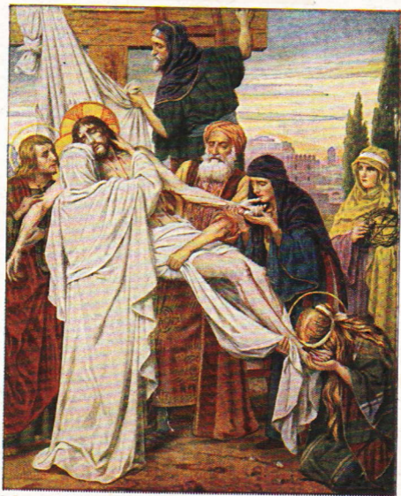
J. Janssens pinx.